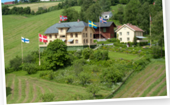
Bjørnstjerne Bjørnsons hjem Aulestad.

(For de som har problemer med dette vil det være mulig å få hjelp av personell i butikken på Maihaugen eller på Lillehammer Kunstmuseum)