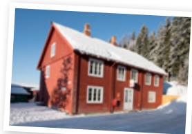
Norges Postmuseum.