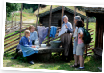
Setra på Maihaugen