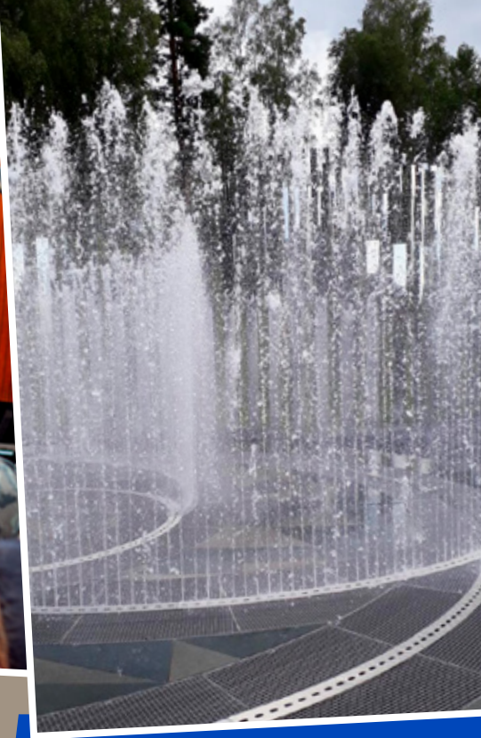
Skulpturen «Path of Silence» av Jeppe Hein. (Kistefoss)

Årets vennetur 1. sept. gikk i år til Kistefoss, Søsterkirkene og Glasslåven på Granavollen.