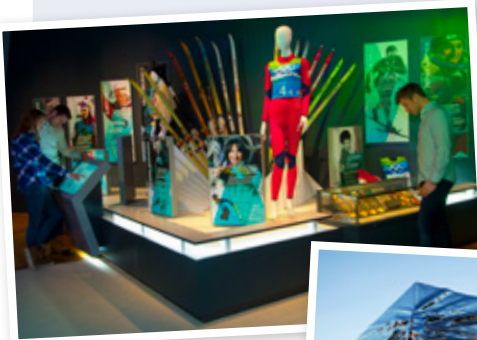
OL-museet på Lillehammer

Hvis de ønsker å kunne gå «gratis» inn på de andre museene som er i Lillehammer Museum, må de kjøpe Venneforeningsmedlemskap med Årskort i tillegg til sitt Livsvarige medlemskap.