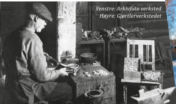
Venstre: Arkivfoto verksted Høyre: Gjørtlerverkstedet