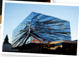
Lillehammer Kunstmuseum.