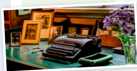
Sigrid Undsets skrivebord på Bjerkebæk.

Enkeltmedlemskap med årskort kr 700/ kalenderår, Familiemedlemskap med årskort kr 1 050/ kalenderår.