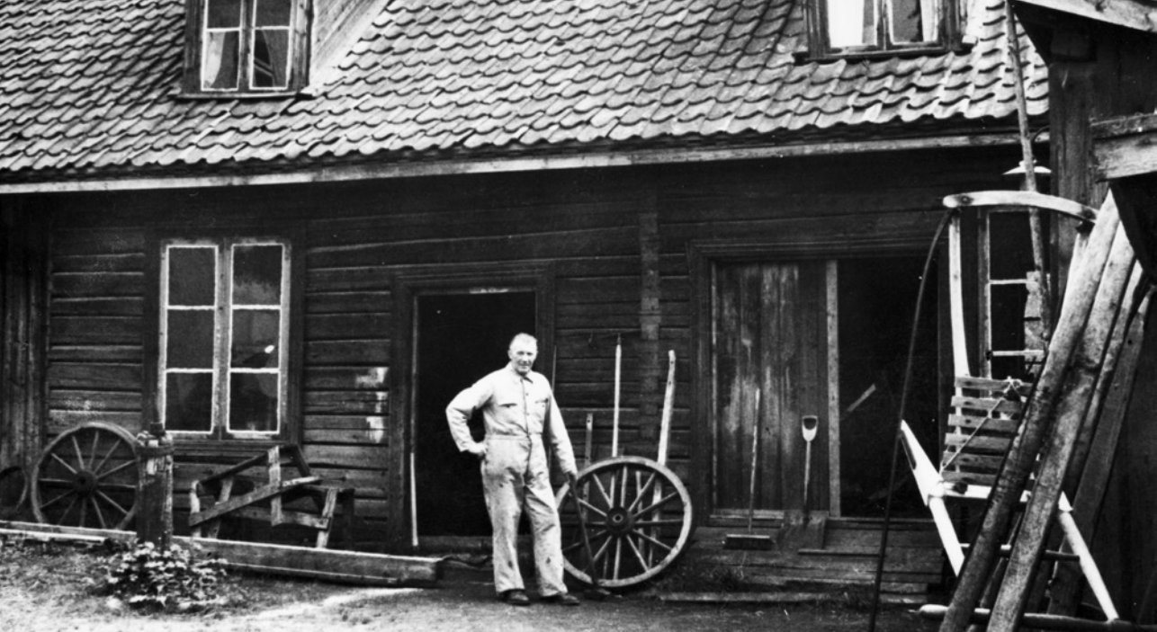
«Gaukstadsmia», ca. 1940-1950