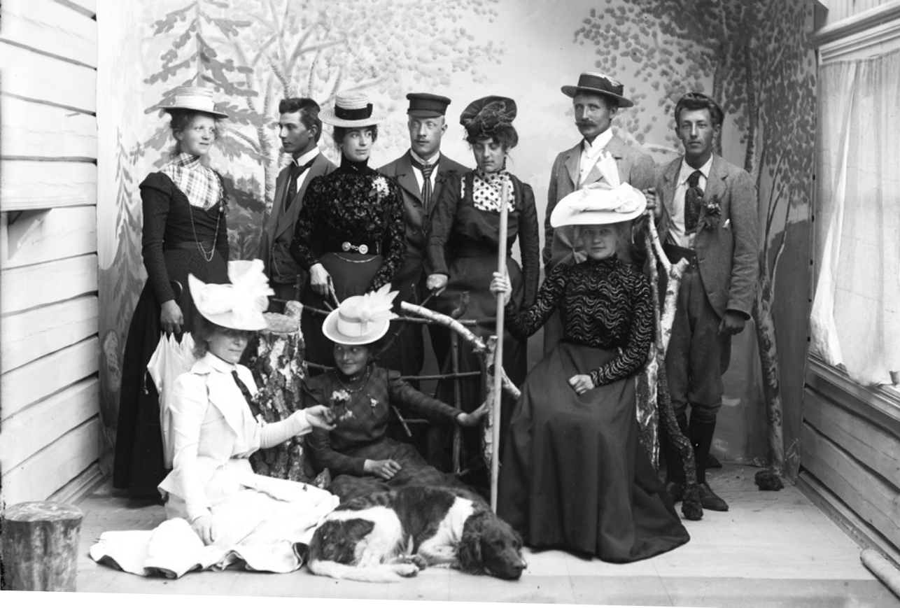
«Et typisk atelierfotografi»

verksteder som ble presentert i DGV, men som nå blir gjenopprettet og lokalisert i Storgata 61, i lokalet der elektromontørutstillingen var.